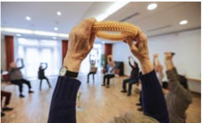
Sport im Seniorenbüro – Seniorengymnastik