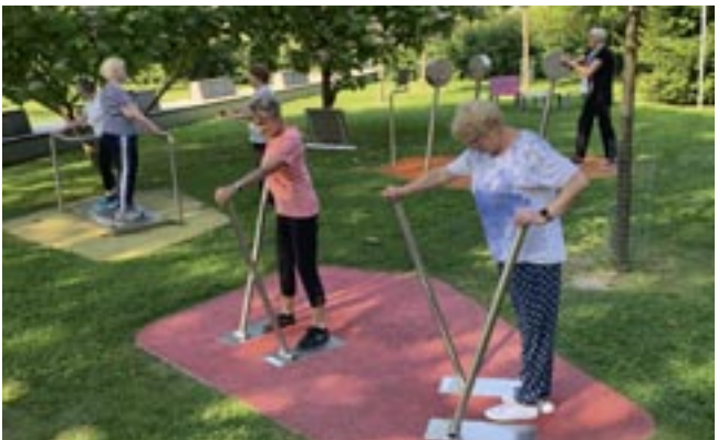
Bürgerpark – unser Fitnessstudio unter freiem Himmel