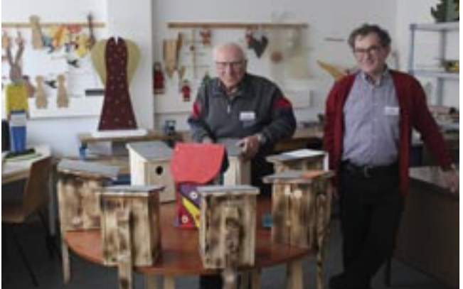
Freude am Selbermachen