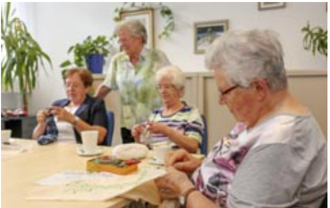
Herzlich willkommen beim Handarbeiten