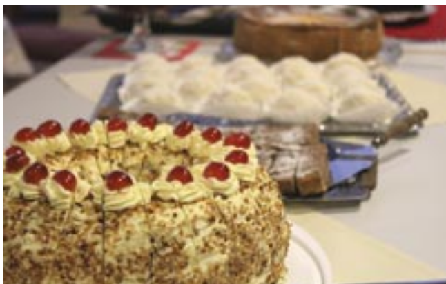
Hausgemachte Kuchen unserer ehrenamtlichen Helfer