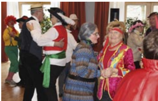
Man muss die Feste feiern, wie sie fallen.