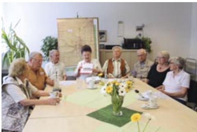
Erlebnisse und Anekdoten von früher – ein reger Austausch im Erzählkreis der Zeitzeugen