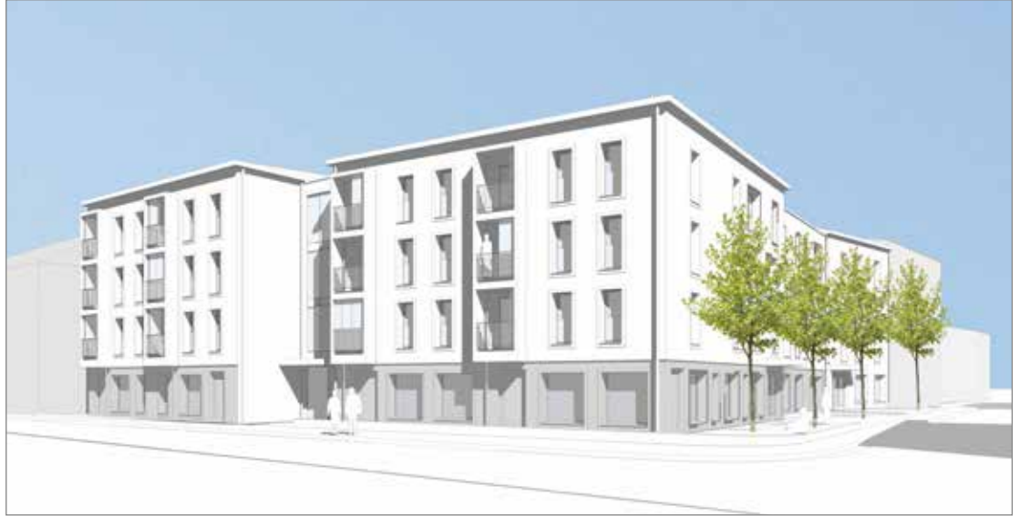
Entwurf der neuen Seniorenwohnanlage St. Franziskus, die im Rahmen der Einkommensorientierten Förderung (EOF) durch das Bayerische Staatsministerium für Wohnen, Bau und Verkehr gefördert wird.

Mitten in der Stadt entstehen in den nächsten Jahren 37 einkom-