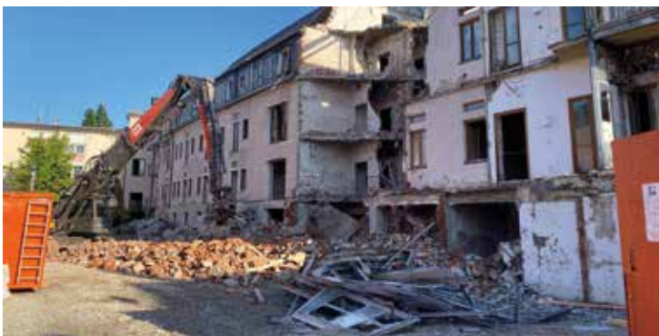
Im Juni 2023 wurde das alte Gebäude in der Spitalstraße abgerissen.