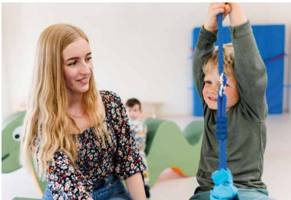
Die pädagogischen Fachkräfte fördern die Entwicklung der Kinder und schaffen Raum für Kreativität.