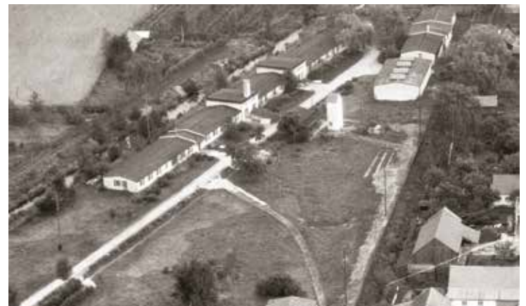
Die Firmengebäude der Luitpold-Werke am Gerolsbach (1957)