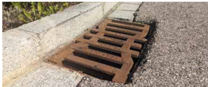
Seit Mitte Oktober reinigt die Stadtwerke alle Sinkkästen im gesamten Stadtgebiet.

Um das zu verhindern, rücken die Stadtwerke ab Mitte Oktober bis Ende November mit den orangenen