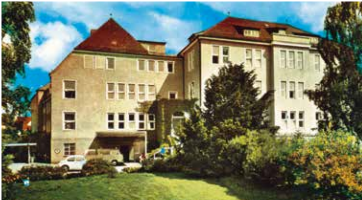
Krankenhaus um 1960