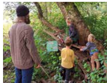
Am Tag der offenen Ilminsel konnten die Kleinen die Natur erkunden.

Der A.p.e. Förderverein hat Groß und Klein am 7. Oktober auf seine Ilminsel eingeladen. Die Natur bietet