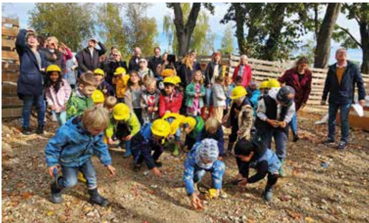
Auf die Plätze, fertig, los! Die Kinder freuten sich über die Süßigkeiten beim Hebauf.