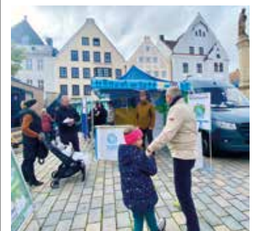
Regier Besuch am PAFundDU-Infostand bei der Herbstdult. Energieberater und Förderprogramme wurden oft angefragt.