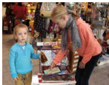
„Geschenk mit Herz“ unterstützt bedürftige Kinder.

Sehr beliebt sind zum Beispiel ein kleines Spielzeug oder ein Kuschel-