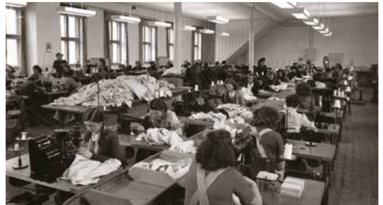
Nähsaal der Firma Blaudruck Groß (um 1950)

Andreas Sauer, Stadtarchivar pafunddu.de/38588