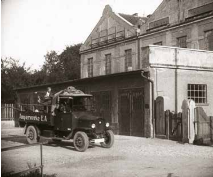
Montage- und Servicewagen der Amperwerke bei der Ausfahrt (ca. 1925)

Pfaffenhofen bot mit einem breit aufgestellten Spektrum an Handwerksbetrieben schon vor Jahrhunderten Möglichkeiten, bei einem der zahlreichen Betriebe Arbeit zu finden. Es gab bis in das 19. Jahrhundert hinein jedoch kaum Arbeitgeber, die mehrere Beschäftigte hatten. Mit den ersten Industriebetrieben und der aufkommenden Technisierung in der Stadt im ausgehenden 19. Jahrhundert begann sich dies zu ändern.