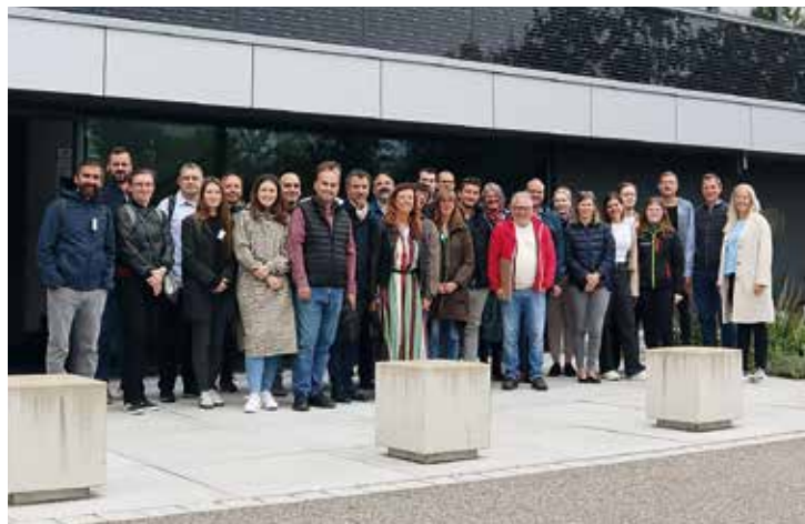
Bürogebäude Eichenseher Ingenieure GmbH, hier vor der PV-Fassade

Vom 11. bis zum 13. September war die Stadt Pfaffenhofen Gastgeber einer internationalen Delegation im Rahmen des EU-Projekts Leeway. 50 Teilnehmer aus Italien, Kroatien, Polen, Belgien, Deutschland sowie dem neu hinzugekommenen Partnerland Bosnien und Herzegowina nahmen an der dreitägigen Veranstaltung teil. Als Gäste waren zeitweise auch Delegationen aus Ungarn und Costa Rica vor Ort, um sich über die Entwicklungen und Potenziale von Energiegemeinschaften zu informieren und auszutauschen.