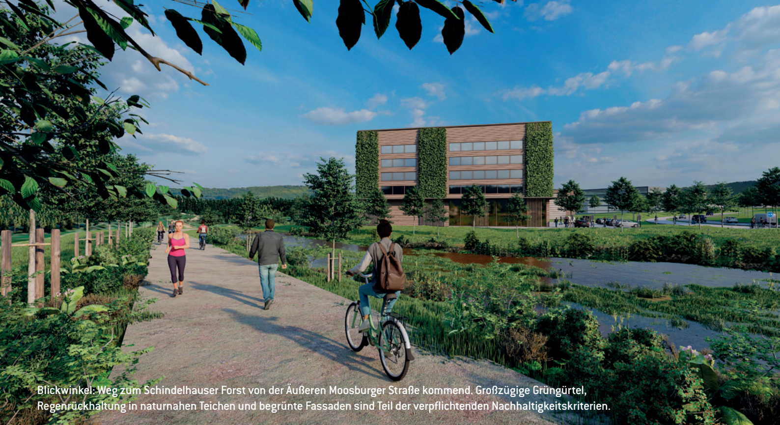
Blickwinkel: Weg zum Schindelhauser Forst von der Äußeren Moosburger Straße kommend. Großzügige Grüngürtel, Regenrückhaltung in naturnahen Teichen und begrünte Fassaden sind Teil der verpflichtenden Nachhaltigkeitskriterien.